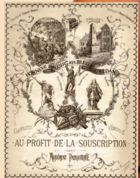
La création musicale interpellée par les tragiques événements de 1870